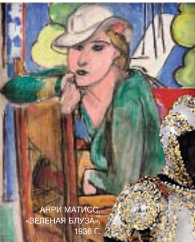
АНРИ МАТИСС, «ЗЕЛЕНАЯ БЛУЗА», 1936 Г.

«ХУДОЖНИК ИЩЕТ ПОМОЩНИЦУ ДЛЯ ВЕДЕНИЯ ДЕЛ. ПОСУДУ МЫТЬ ЗАСТАВЛЯТЬ НЕ БУДУТ. ОБ УЩЕРБЕ ДЛЯ НЕВИННОСТИ МОЖНО НЕ БЕСПОКОИТЬСЯ, Я ЖЕНАТ». ПО ОДНОЙ ИЗ ВЕРСИЙ, БЛАГОДАРЯ ТАКОМУ ОСТРОУМНОМУ ОБЪЯВЛЕНИЮ В ГАЗЕТЕ АНРИ МАТИСС НАШЕЛ СЕБЕ НЕ ТОЛЬКО СЕКРЕТАРЯ И ДРУГА, НО И... МУЗУ. В МУЗЕЕ МАТИССА В LE SATEAU-CAMBRESIS ДО 30 МАЯ РАБОТАЕТ ВЫСТАВКА, ПОСВЯЩЕННАЯ ЛЮБИМОЙ МОДЕЛИ ХУДОЖНИКА – ЛИДИИ ДЕЛЕКТОРСКОЙ.